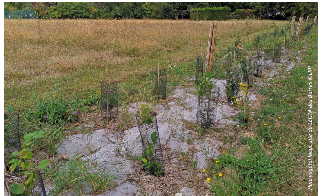
Haie végétal local, site du LEGTA des Barres

au Lycée d'Enseignement Général et Technologique Agricole du Chesnoy + accès à distance en direct